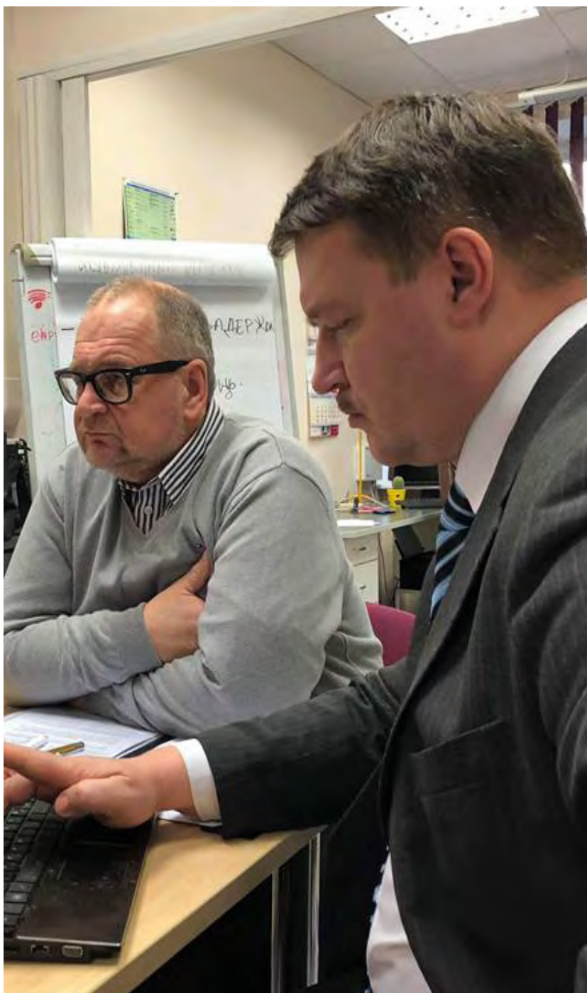
Юристы работают над справочником.

Получена договоренность о сотрудничестве с юристами. Иными словами, у Lunest есть юридическая поддержка и адвокационное представительство! На данный момент справочник практически закончен и ждет окончательного одобрения и отправки в печать.