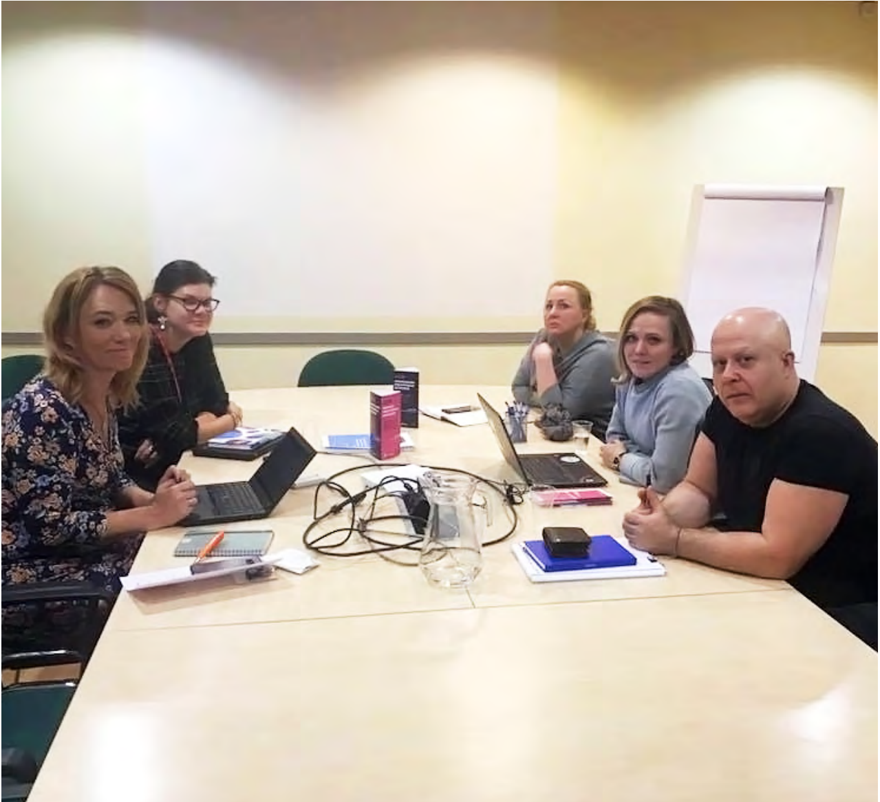
На встрече с Национальным Институтом Развития Здоровья.