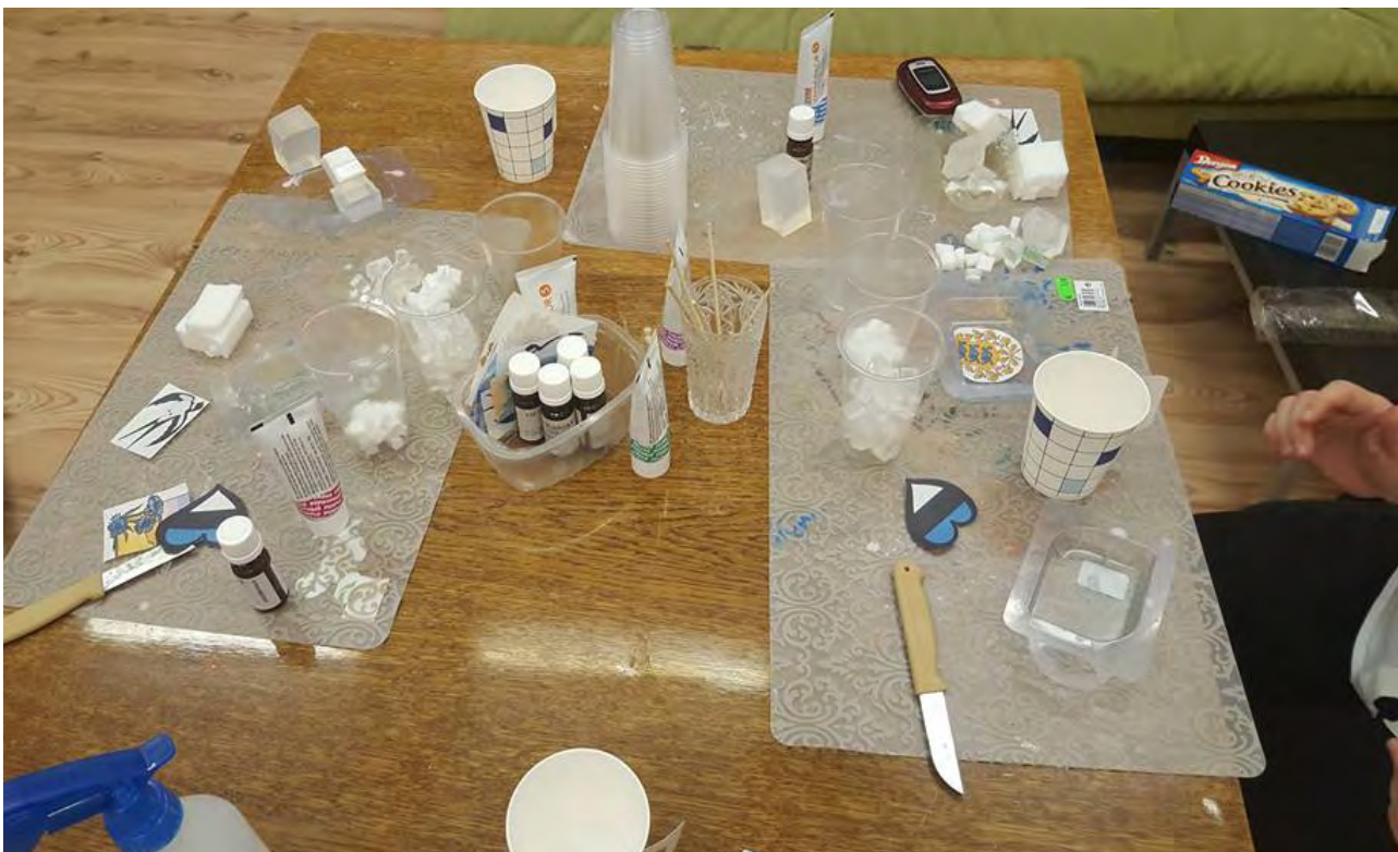
Работа над авторским оформлением мыла

https://rus.err.ee/687837/junye-narvitjane-vruchili-podarki-v-popechitel'skom-dome-narva-jyesuu