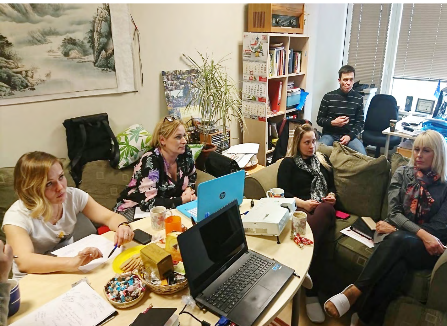
На тренинге по фандрайзингу.

На данном этапе в консорциуме создана команда по фандрайзингу. Разрабатывается фандрайзинговая стратегия.