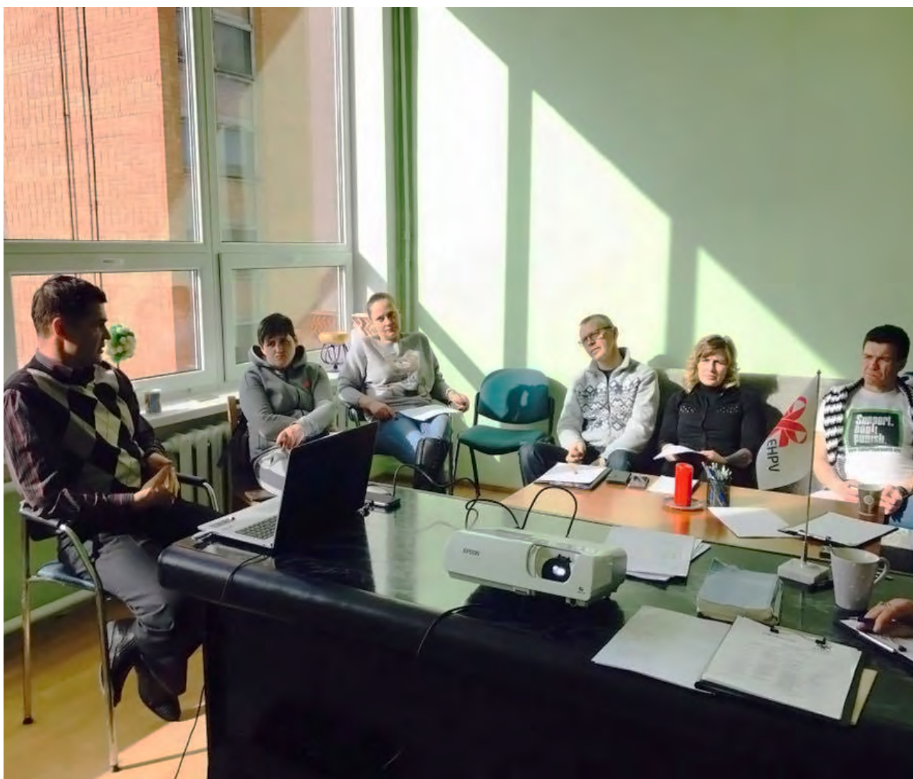
На семинаре по гепатиту С.

В рамках обучения активисты и консультанты получают знания о заболевании, его течении, прогнозе, современных способах лечения и профилактики осложнений и вторичных заболеваний. Отдельно хочется отметить, что тренинги проводятся, в первую очередь, для людей, страдающих вирусными хроническими гепатитами. Тренинги организуются в целях дальнейшего