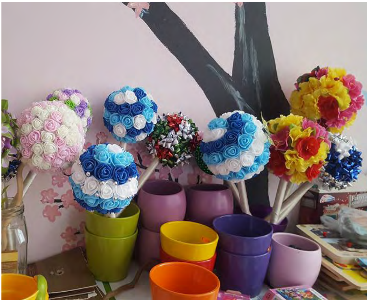
Деревья, изготовленные руками детей. Кому-то они принесут счастье.