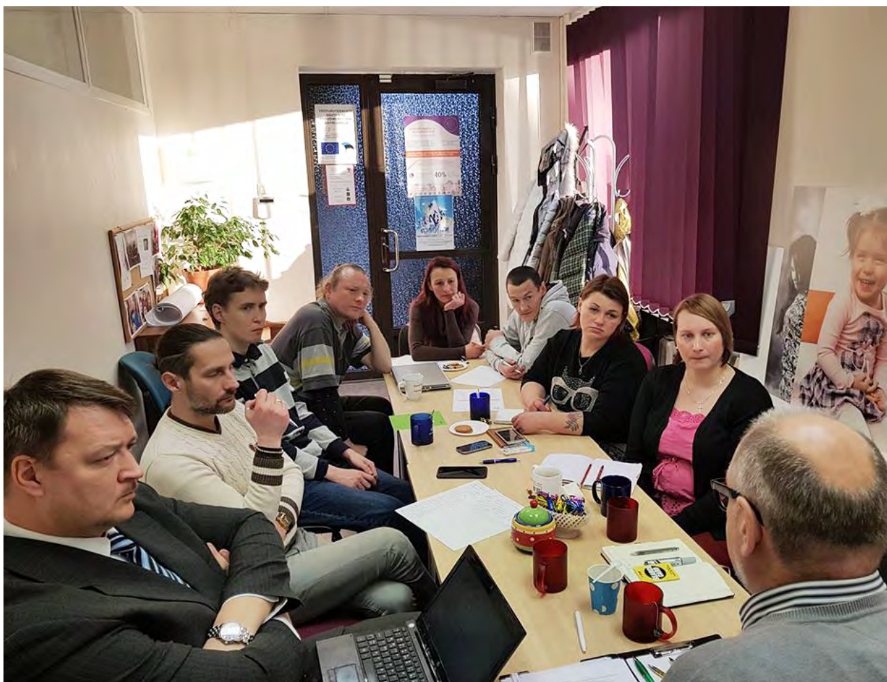
Встреча с юристами 9 января

Мы считаем, что страна, в которой люди родились и выросли, пусть даже по каким-то причинам они не смогли получить гражданство страны, в которой родились, должна нести за них ответственность до конца, а не скидывать свои проблемы на ближайших соседей. В связи с этим отрадно сообщить, что Lunest заключил договор о сотрудничестве по данному вопросу с юридическим бюро SIDIV и первая ласточка, первый выигранный судебный процесс, в отношении человека, совершившего преступление первой степени тяжести, состоялся! Пусть это лишь шаг, но надеемся, что за ним пойдут и другие, главное не останавливаться и идти вперед!